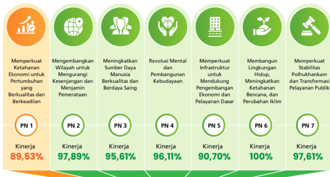
Gambar 3.1. Pencapaian Prioritas Nasional Tahun 2022 Berdasarkan Kinerja Efektivitas Sasaran Pembangunan (Bappenas, 2023)

Telaahan terhadap kebijakan nasional dan sebagaimana dimaksud, yaitu penelaahan yang menyangkut arah kebijakan dan prioritas pembangunan nasional dan yang terkait dengan tugas pokok dan fungsi Perangkat Daerah. Berdasarkan Peraturan Menteri Perencanaan Pembangunan Nasional / Kepala Badan Perencanaan Pembangunan Nasional Nomor 4 tahun 2023 tentang Rencana Kerja Pemerintah Tahun 2024 ada 7 (tujuh) Program Prioritas Tahun 2024 sebagai berikut: